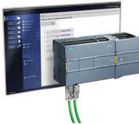
CPU 1215FC ve TIA Portal

Dijital giriş simülatörü SIM1274, SIMATIC S7-1200 dökümantasyon CD'si