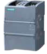
SIMATIC S7-1200 Güç Kaynağı