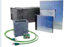
SIMATIC S7-1200 Başlangıç Paketi

* Başlangıç Paketlerinde indirim yapılmamaktadır.