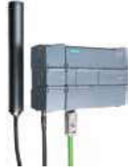
CP1242-7 GSM/GPRS Modem

* CP1242-7 V2 minimum TCSB V3+SP1 ve CPU firmware V4.1 ile çalışır.