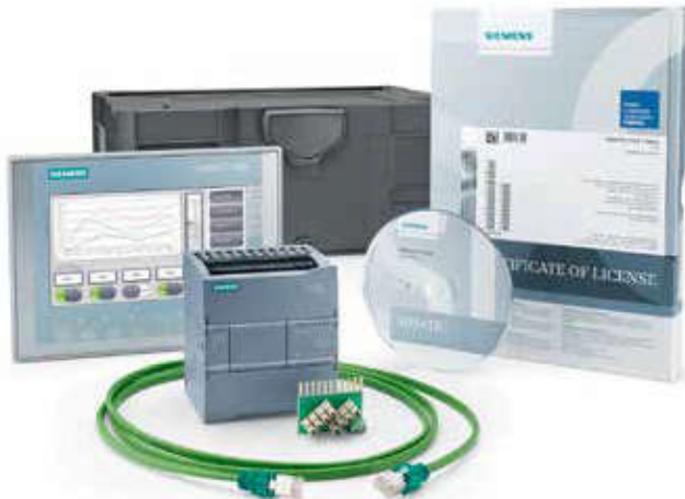
SIMATIC S7-1200 + KTP700 Basic Başlangıç Paketi

* Başlangıç Paketlerinde indirim yapılmamaktadır.